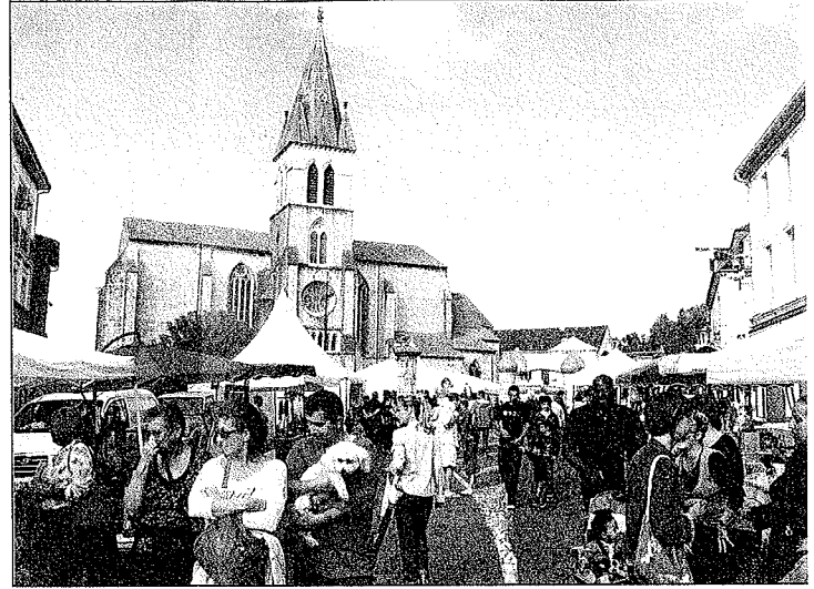
Dimanche, à partir de 16 h, l'axe Moutête/Francis Planté a été pris d'assaut par les visiteurs, heureux de se promener sous le soleil.

Concentrer les exposants sur l'axe Moutête/Francis-Planté (un peu comme le marché du mardi) a été une idée judicieuse. La « nouvelle » formule de la foire a favorisé la circulation des visiteurs qui ont apprécié la diversité des stands proposés. Pour autant, la nocturne du samedi est à revoir.